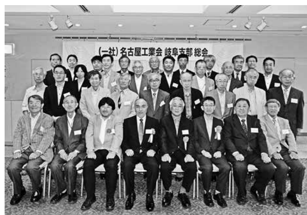
総会終了後の集合写真