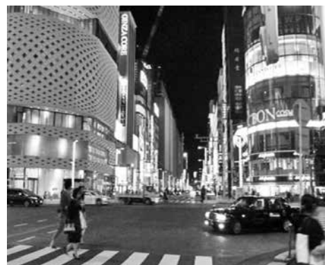
夜の銀座四丁目交差点