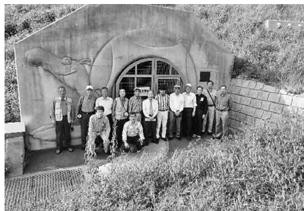
排水トンネル前にて